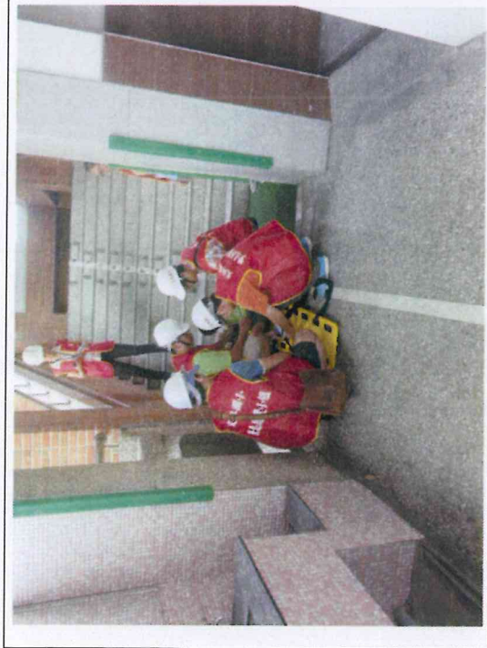
地點：懷恩樓與文心大樓二樓樓梯間