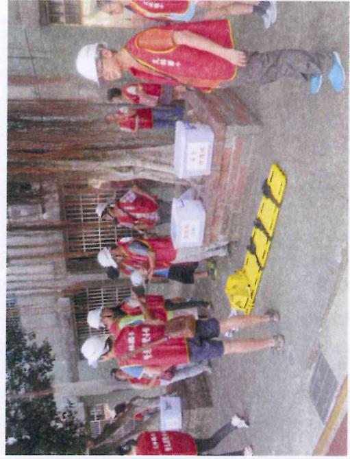
本學期起，將各任務編組硬體設備，分批裝箱至各組組別之整合箱內(內涵對講機、帽子、防救背心、點名冊等)。