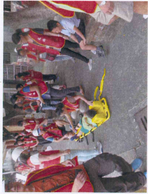
地點：緊急指揮中心(醫療站)